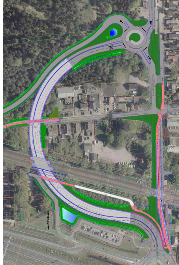
Westvariant met afgesloten Tuindorpweg