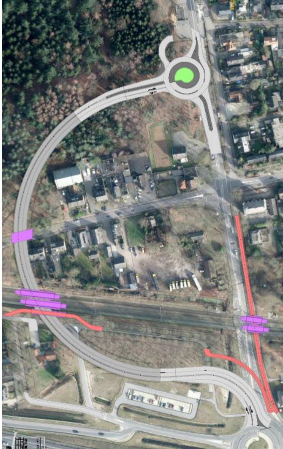
Westvariant met open Tuindorpweg

Er waren (naast Dorpsplan en Bos-Beek) twee Westvarianten waarvan er één gekozen is: