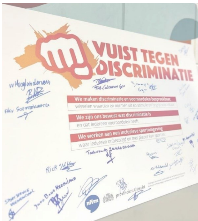
Afbeelding 4: Ondertekend manifest Vuist tegen Discriminatie.

In opdracht van de provincie Utrecht heeft het Nederlands Instituut voor Vechtsport & Maatschappij (NIVM) een project tegen discriminatie bij 28 sportclubs in diverse Utrechtse gemeenten uitgevoerd. Kern van het project is de interventie 'Vuist' geweest, waarmee het NIVM bij de deelnemende sportclubs de basis heeft gelegd voor duurzame nieuwe ontmoetingen, het werken aan een open cultuur waar iedereen welkom is en waar sociale inclusie op de sportvloer een prominente plek heeft. Het project is uitgevoerd bij 13 vechtsportclubs, 5 judoclubs en 11 overige sportclubs (zoals voetbal-, atletiek- en hockeyverenigingen). De activiteiten bij en met de clubs vonden plaats vanuit de waarden 'deze club maakt een vuist tegen discriminatie'. Trainers op deze clubs zijn geschoold, er is actief op communicatie ingezet en clubs zijn ondersteund bij het stimuleren van nieuwe ontmoetingen. Een van de resultaten is dat er bij de clubs initiatieven zijn opgezet waarbij veel jeugd uit de club en nieuwe geïnteresseerden in aanraking zijn gekomen met het thema discriminatie. Hiermee zijn volgens het NIVM 4500 mensen bereikt. Een aantal sportverenigingen gaat volgend jaar een verdiepingsslag maken met het NIVM en er wordt met nieuwe sportverenigingen samengewerkt. Deze uitkomsten zullen ook geborgd worden bij het nieuwe programma 'Onze club is van iedereen' (OCIVO) van sportkoepelorganisatie NOC*NSF.