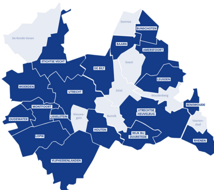
Afbeelding 3: Op deze kaart zijn de gemeenten in blauw aangegeven waar Utrechtse Plus een samenwerking is gestart (status 30 november 2023).

Het 'Utrechtse Plus' verduurzamingsproject is een aanvulling op landelijke en lokale regelingen en initiatieven en zet zich in voor energiebesparing, opwekking van duurzame energie en klimaatadaptatie bij sportverenigingen. Doelstelling is om voor 31 december 2024 kennismakingsgesprekken te hebben gevoerd met 100 sportverenigingen, energiescans te hebben uitgevoerd bij 60 sportverenigingen en dat bij minstens 40 sportverenigingen begonnen is met het uitvoeren van maatregelen. De stand van zaken is dat per 1 december 2023 contact gelegd is met 49 sportverenigingen, bij 25 sportverenigingen zijn energiescans uitgevoerd en bij 5 sportverenigingen zijn de eerste maatregelen getroffen. Tot en met eind november 2023 zijn er 18 gemeenten in provincie Utrecht in gesprek met de Utrechtse Plus.