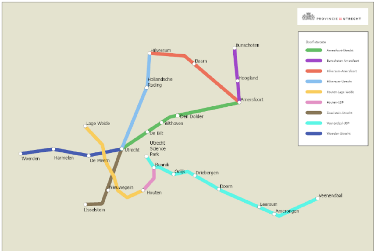
Kaart Weergave van de negen prioritaire doorfietsroutes