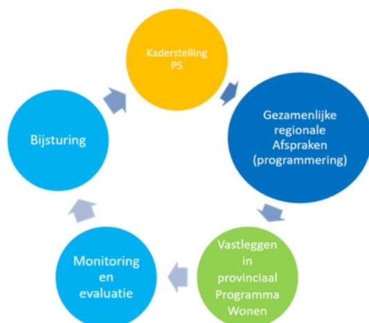
Figuur 3.1: Verbeelding regionale programmering

Samen met de gemeenten en regio's komen we tot een aanpak per regio. Hierin wordt uitgelijnd welke informatie er beschikbaar is, aan welke trajecten wordt gewerkt, welke partijen er betrokken worden (bijvoorbeeld corporaties en marktpartijen), hoe overleg en besluitvorming plaatsvindt en welke planning wordt gehanteerd. Ook worden afspraken gemaakt over monitoring, evaluatie en bijstelling. Daarbij koersen wij op vaststelling van het eerste regionale programma uiterlijk het eerste kwartaal 2021. Op deze manier kan het provinciale programma voor het van kracht worden van de Omgevingsvisie en de nieuwe regels in de Interim Omgevingsverordening door GS worden vastgesteld.