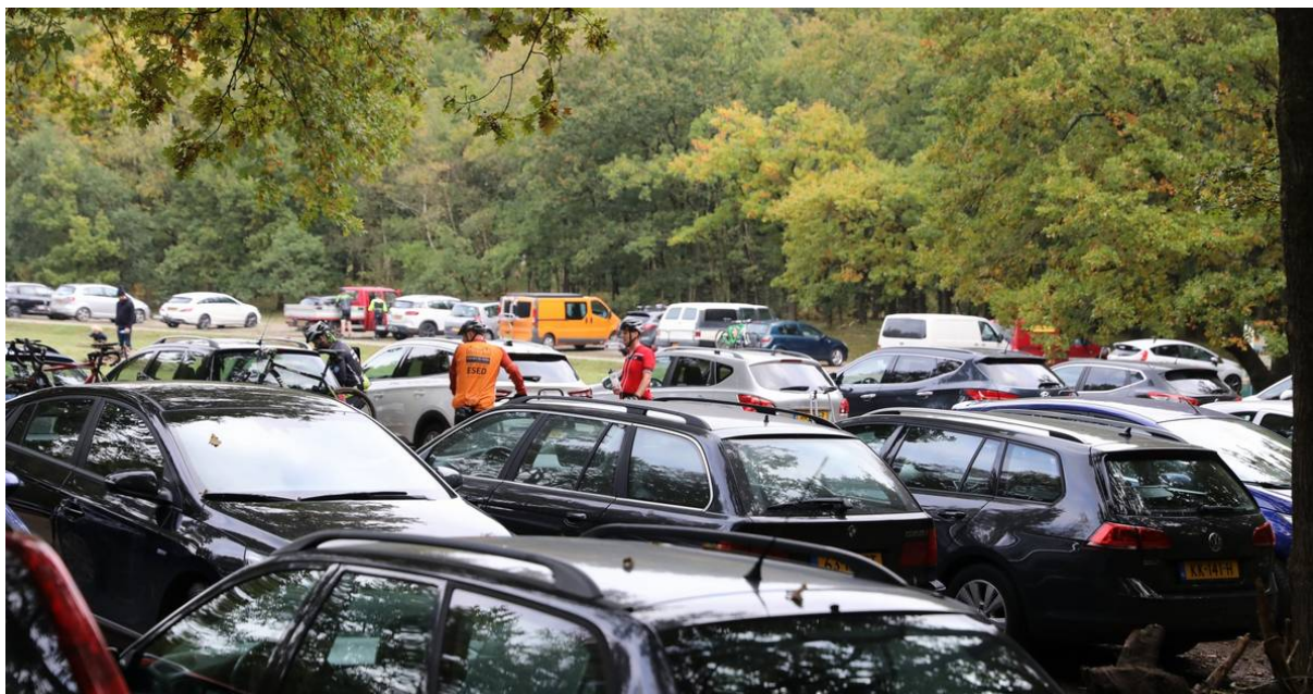
De parkeerplaatsen, zoals hier in de natuurterreinen rondom Soest en Baarn, stonden het afgelopen jaar regelmatig bomvol. Met moeite was er nog een plekje te vinden.

BOA's van de natuurbeheerder geven sinds het uitbreken van deze pandemie hun bevindingen t.a.v. drukte in de natuur tijdens het weekend door aan de BOA-coördinator, die deze informatie samenvoegt en doorgeleidt naar hen die op basis van deze informatie beslissingen kunnen nemen.