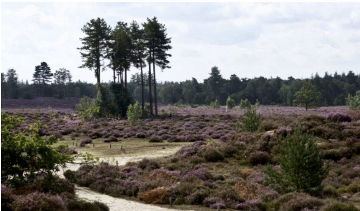
De Leusderheide op den Treek

De afgelopen weken was het soms erg druk in natuurgebieden. Voor veel mensen is een boswandeling in het weekend een van de weinige overgebleven uitjes. De gemeente Baarn heeft al meermaals mensen moeten oproepen niet meer naar het dorp Lage Vuursche te komen, daar waren de parkeerplaatsen enkele keren overvol.