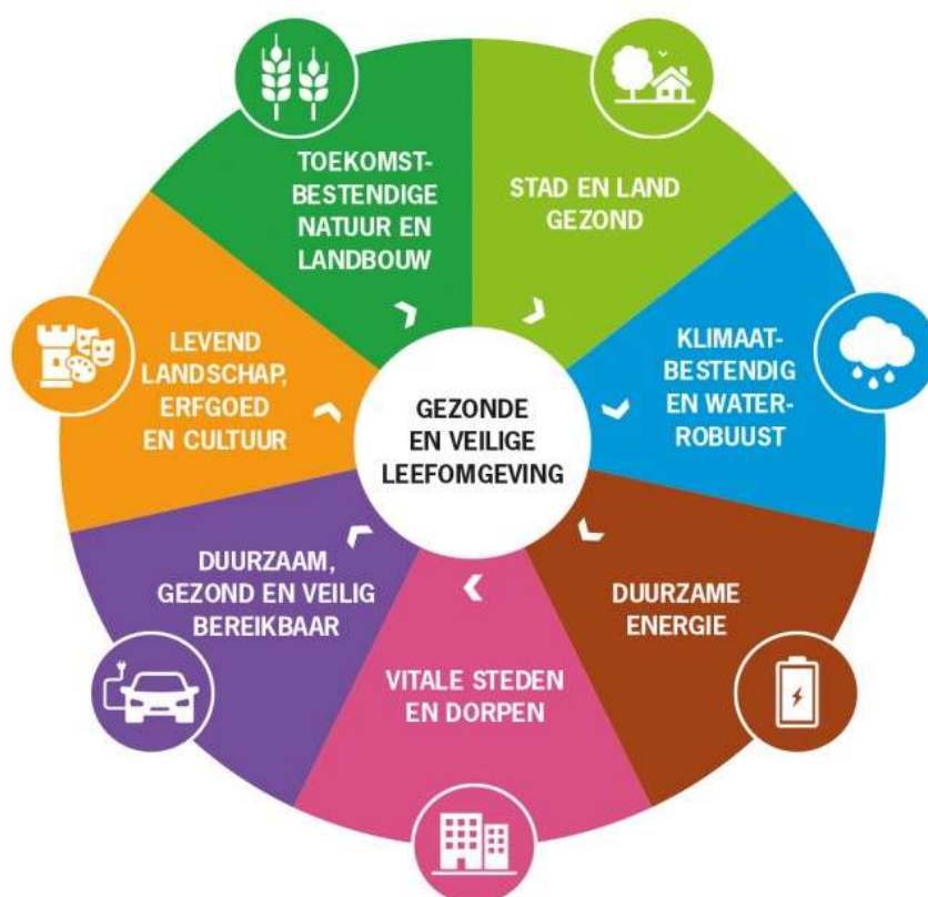
Figuur 3: de zeven thema's van de Omgevingsvisie

De Omgevingsvisie van de provincie geeft een integrale visie op het provinciale beleid voor de fysieke leefomgeving. De visie is na uitgebreide interne en externe participatie ontstaan en geeft de provinciale ambities tot 2050 weer met meetbare (tussen)doelen. De provincie formuleert wat ze in 2025 / 2030 / 2040 op zijn minst bereikt moeten hebben om de ambities te verwezenlijken. De Omgevingsvisie is opgebouwd rond zeven thema's (zie figuur 3).