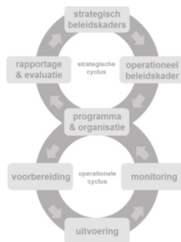
Figuur 1: De Big 8-cyclus

Dit programma bestaat uit twee onderdelen. Het algemeen deel (deel I) beschrijft voor de provincie Utrecht op hoofdlijnen de inhoud en organisatie van de bovenste Big 8-cirkel, de (strategische) beleidscirkel. Hoofdstuk 2 beschrijft hoe de bestaande inhoudelijke beleidskaders voor de VTH-taakuitvoering veranderen door de komst van de Omgevingswet. Hoofdstuk 3 gaat in op de totstandkoming van beleidsdoelen. Een aparte