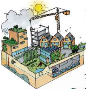
Nieuwbouw- en herstructurering klimaatadaptief