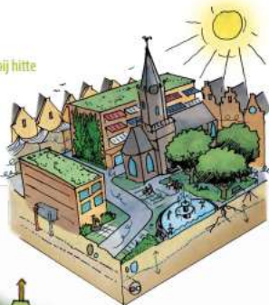
Leefbaarheid bij hitte