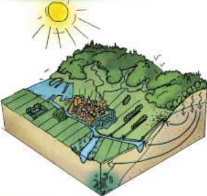
Versterken natuurlijk (water)systeem