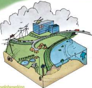
Gevolgbeperking klimaat effecten vitale en kwetsbare functies