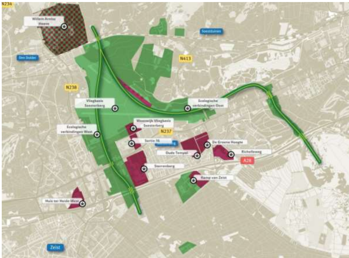
Figuur 3: Overzichtskartaal projecten Hart van de Heuvelrug en Vliegbasis Soesterberg

In dit hoofdstuk is per project de tussenrapportage uitgewerkt. Per project is allereerst de statische projectinformatie gepresenteerd, zoals gehanteerd wordt in de projectopdracht vanuit de stuurgroep Hart van de Heuvelrug. Vervolgens is per project de stand van zaken, het vervolgproces en nieuwe kansen en risico's uitgewerkt.