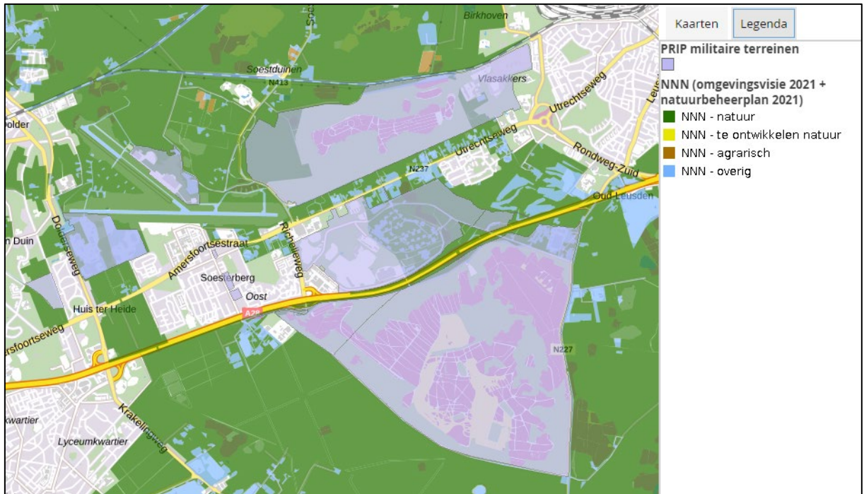
Kaartje NNN i.r.t. defensie terreinen.