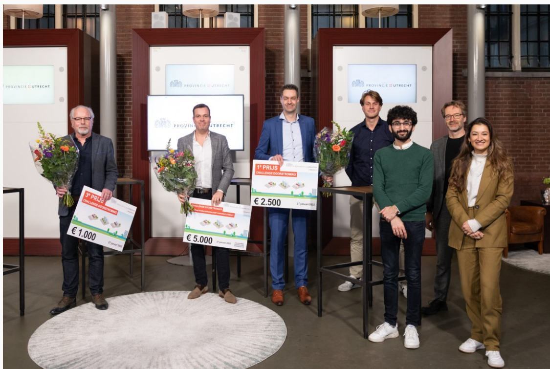
De aanwezige finalisten, v.l.n.r.: Stade Advies, Tellers & Benoemers, Floqz, Clappform, Steenvlinder, Kleinlandgoedmakers, APTO Architects.

Wilt u op de hoogte blijven van alles dat de provincie Utrecht onderneemt op het gebied van doorstroming op de woningmarkt? Houd dan de website van het programma Versnelling Woningbouw in de gaten.