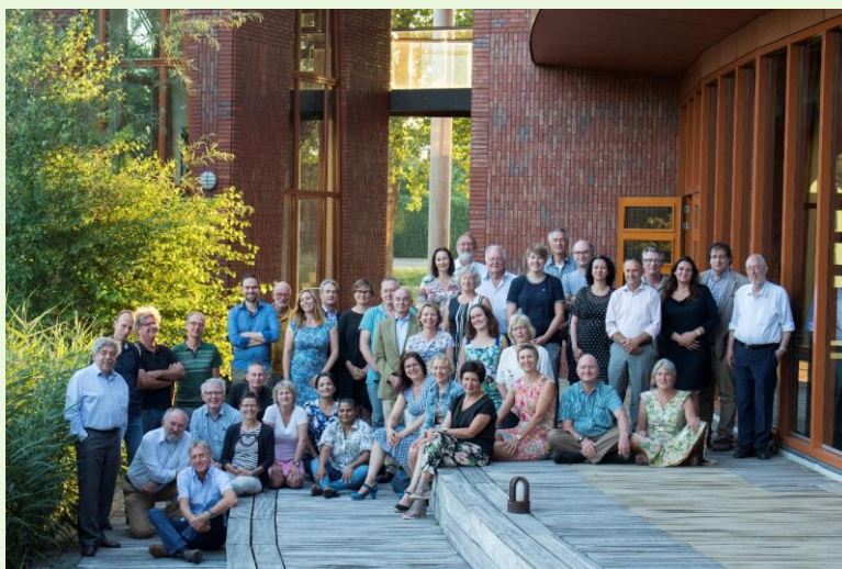
Een deel van de Water Natuurlijk-kandidaten voor de waterschapsverkiezingen van 2019

Wil je graag eerst meer weten over ons werk en over Water Natuurlijk? Neem dan contact met ons op voor een vrijblijvend informatief gesprek.