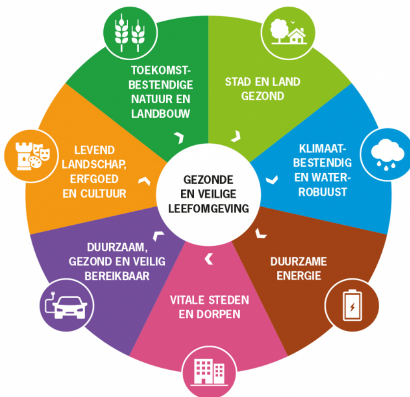
Figuur 2: de zeven thema's van de Omgevingsvisie

De Omgevingsvisie van de provincie geeft een integrale visie op het provinciale beleid voor de fysieke leefomgeving. De visie is na uitgebreide interne en externe participatie ontstaan en geeft de provinciale ambities tot 2050 weer met meetbare (tussen)doelen. De provincie formuleert wat ze in 2025 / 2030 / 2040 op zijn minst bereikt moeten hebben om de ambities te verwezenlijken. De Omgevingsvisie is opgebouwd rond zeven thema's (zie figuur 2).