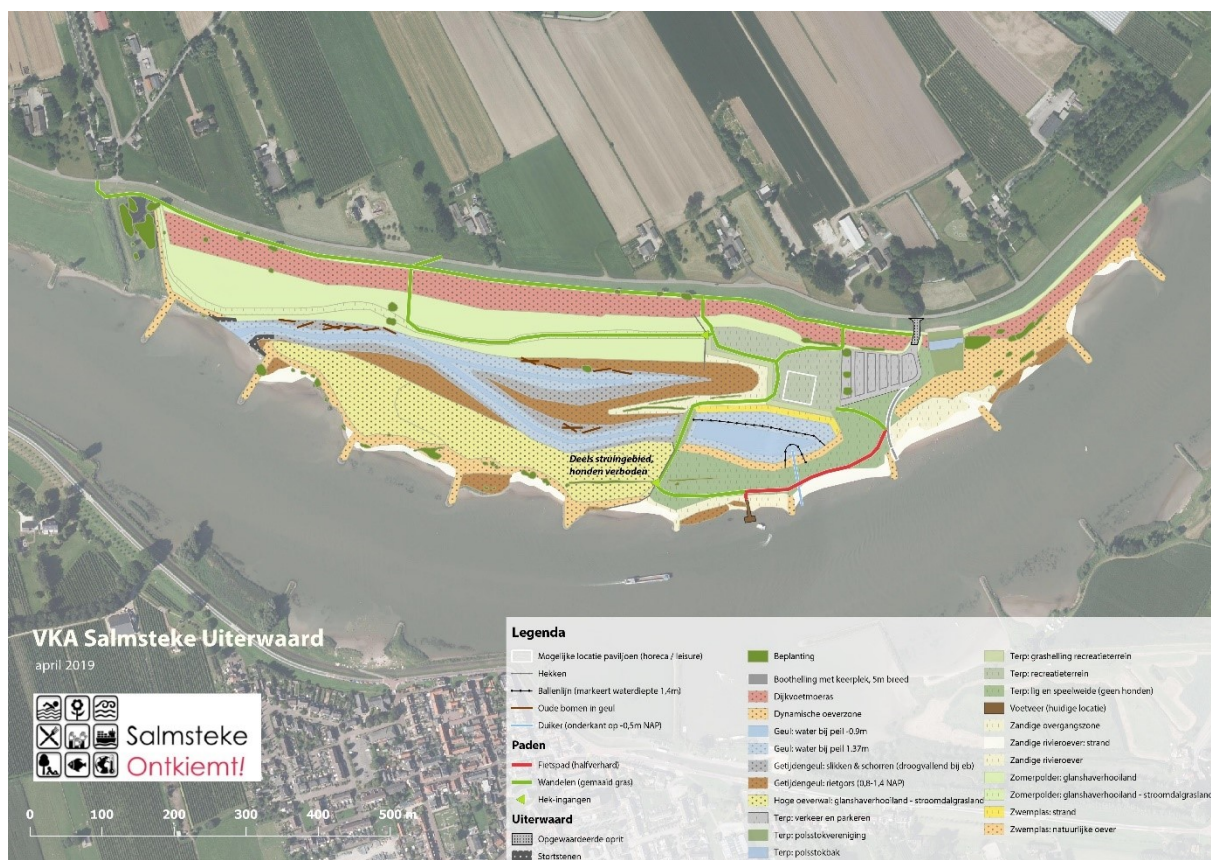
Figuur 2. Voorkeursalternatief Salmsteke Uiterwaard, juni 2019

In de Plan&Realisatiefase wordt dit voorkeursalternatief nader uitgewerkt tot een definitief ontwerp en uitvoeringscontract. Planning is dat de oplevering in 2023 plaatsvindt.