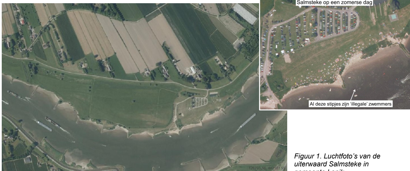
Figuur 1. Luchtfoto's van de uiterwaard Salmsteke in gemeente Lopik.

In figuur 1 is de luchtfoto van de huidige ligging en inrichting van de uiterwaard zichtbaar. Er is een parkeerplaats, een pad naar het voetveer en gemaaide wandelpaden in het gebied. Op het kleine fotobeeld is zichtbaar dat op een zomerse dag veel mensen vanuit de hele regio naar deze uiterwaard gaan om verkoeling te zoeken aan en in de rivier, terwijl daar waarschuwingsborden staan dat omwille van veiligheid er niet in de rivier mag worden gezwommen.