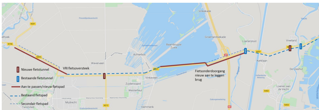
Afbeelding 2: traject vanaf Vreeland naar Amstelhoek (N196)

Voor het fietsverkeer is gekeken naar het huidige traject vanaf Vreeland naar Amstelhoek (N196) (zie bijlage 2). In de voorkeursvariant is reeds rekening gehouden met een aantal fietsmaatregelen die tevens de doorstroming ten goede komen (zie afbeelding 2).