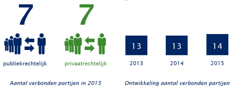
Aantal verbonden partijen in 2015