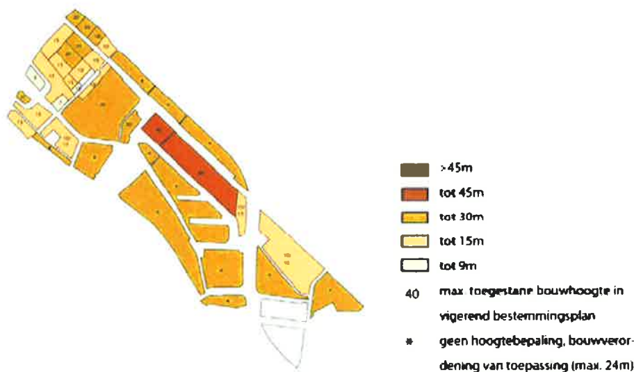
Figuur 3.4 B Bouwhoogtes die mogelijk zijn volgens het huidige geldende bestemmingsplan

Concreet betekent het dat gebouwen tot een hoogte van 30 m in principe geen probleem vormen. Dit zijn de bouwhoogten die met een ontheffing reeds zijn toegestaan in het huidige bestemmingsplan. In een beperkte zone, langs de Isotopenweg, zijn in het bestemmingsplan bouwhoogten tot 45 m toegestaan. Dit kan eventueel beperkte gevolgen hebben voor één van de windmolenlocaties (niet opgenomen in het voorkeursalternatief). Het belangrijkste is om de hoek tussen west en zuid vanaf de windmolens vrij te houden van grote obstakels.