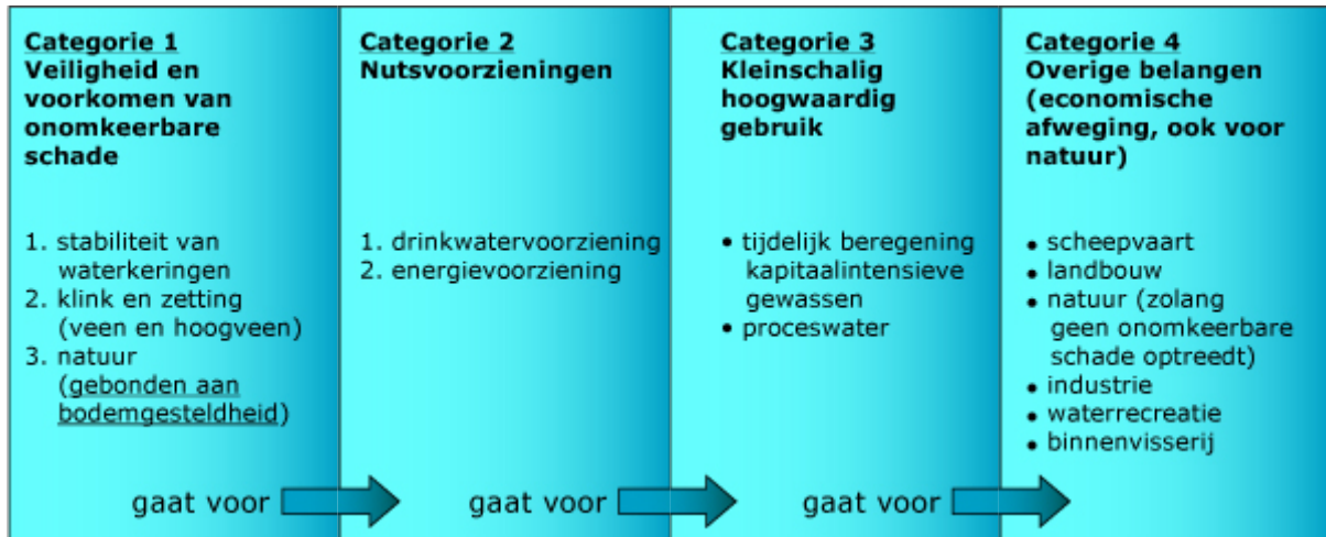
Figuur 2. Landelijke verdringingsreeks

categorie 1: veiligheid en het voorkomen van onomkeerbare schade (landelijke verdringingsreeks)