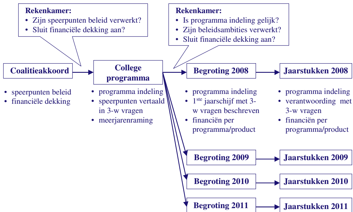
Figuur Aansluiting sturing en verantwoordingsdocumenten