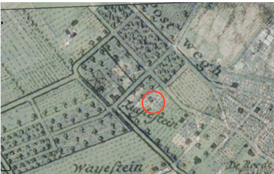
Figuur 1: de historische verhouding tussen landgoed en agrarische erf bebouwing

Door een historisch sterk verweven relatie van het agrarisch erf op het landgoed dient deze erfrelatie geïnterpreteerd te worden in samenhang met de hoofdbebouwing van Zuylestein. Het agrarisch bedrijf is door een langdurig en zelfs historisch verweven ligging, een visueel herkenbaar onderdeel van het landgoed ensemble (zie Figuur 1+2).