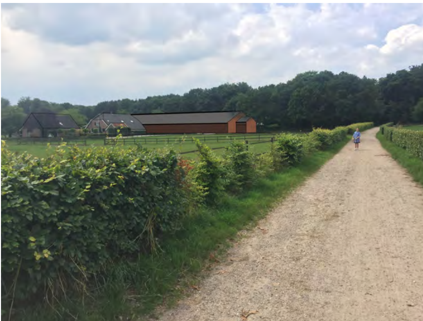
Figuur 3: fotomontage van het zicht met voorgenomen veestal, vanaf het met hagen omkleed wandelpad tussen Amerongen en landgoed Zuylestein. Duidelijk zichtbaar is overlap van de voorgenomen veestal op de historische omwalling.

De samenhang is beleefbaar door de aanwezigheid van een veelgebruikte looproute tussen de westkant van Amerongen van en naar het landgoed, waardoor zicht mogelijk is op de landschappelijke eenheid van het landgoed (zie Figuur 3). Of deze situatie verholpen kan worden door een verbeterd erf inrichtingsplan, zoals gesuggereerd door Mooi Noord-Holland, betwijfel ik. De beschikbare ruimte op het kavel zal een benodigde variatie van locatie of aanplant van meer 'groene buffer' zeer lastig maken.