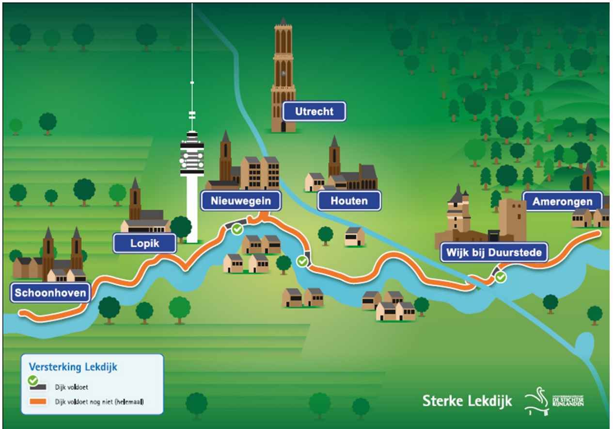
Figuur 1: Traject Lekdijk