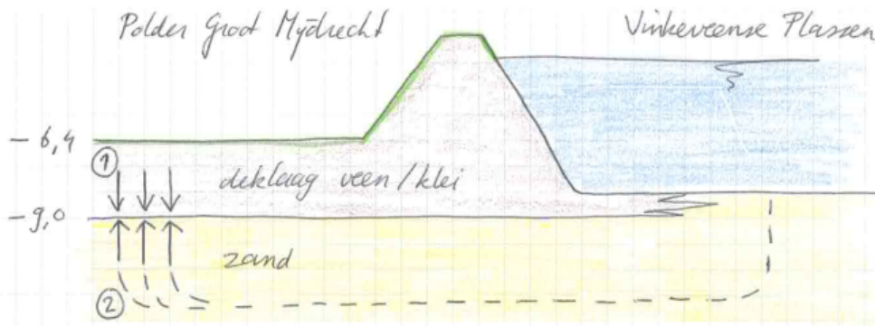
Figuur 2: principe opbarsten van de bodem:

veiligheidsmarges is 9 (zie ook figuur 1). In zone 2 wordt om deze reden niet gegraven. Hier is de bodemstabiliteit te laag.